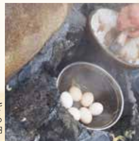
▶小沢の湯でつくる温泉卵

こちらの写真のとおり、小沢の湯では温泉卵を作ることができます。温泉の蒸気で蒸し上げた美味しい手作りの温泉卵は、手軽なお土産としても人気です。生卵は向かいの商店で買うことができます。小沢の湯は古来からある熱海の源泉の一つであり、「熱海七湯」の一つです。「熱海七湯」は、スポット⑤の大湯など個性豊かな源泉ですので、それぞれ巡ってみてはいかがでしょうか。