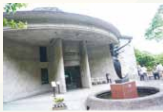
◀澤田政廣記念美術館外観

「今回はみんな歩くのが早そうだから」と井沢さんの案内で保養所周辺レクリエーション施設の熱海市立澤田政廣記念美術館へ寄り道。入口天井にあるステンドグラス「飛天」は、静岡県内でも人気のパワースポットで、頭上だけでなく床に映る様も美しいので足元でも楽しめます。館内では、澤田政廣の詩情あふれる彫刻や絵を満喫しました。