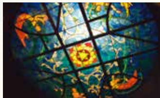
◀ステンドグラス「飛天」