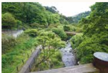
▲梅園の新緑の景色

緑が深くなっていく初夏や紅葉が見事な秋も熱海梅園は魅力的!!植物だけでなく、2000年に熱海で開催された日韓首脳会談を記念して整備された韓国庭園や、晩年を熱海で過ごした作曲家